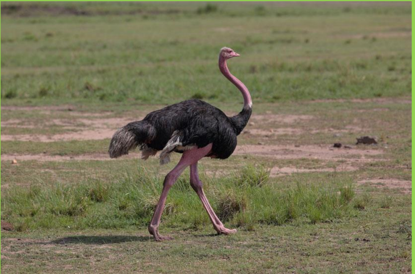
Autruche mâle

Comprenant 4 sous-espèces, vivant toutes en Afrique, l'autruche est le plus gros oiseau de la planète avec le casoar à casque. Possédant un dimorphisme sexuelle important, la femelle, au plumage gris brun, se différencie assez bien du mâle au plumage noir et dont l'extrémité des ailes est blanche. L'autruche qui est un oiseau aptère, c'est à dire qui ne vole pas, compense cet handicap grâce à sa vitesse sur le sol, en atteignant pas moins de 70 km/h à la course. Lors de la parade nuptiale,