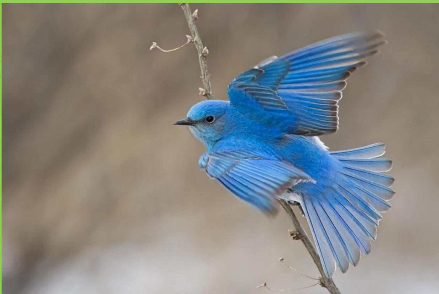
Merlebleu azuré mâle - (Photo Raymond Lee)

Même si le sujet fait débat pour savoir si le merlebleu azuré fait partie de la famille des turdidés ou des muscicapidés, ce bel oiseau bleu se rapproche un peu plus de la grive, que du merle noir . Emblème des états de l'Idaho et du Nevada, ce petit passereau d'Amérique du Nord, est également célèbre, pour avoir servi de modèle, au logo d'un célèbre réseau social. Migrant par bandes, dans les régions les plus au Sud, au moment de l'hiver, le merlebleu azuré, dont le régime